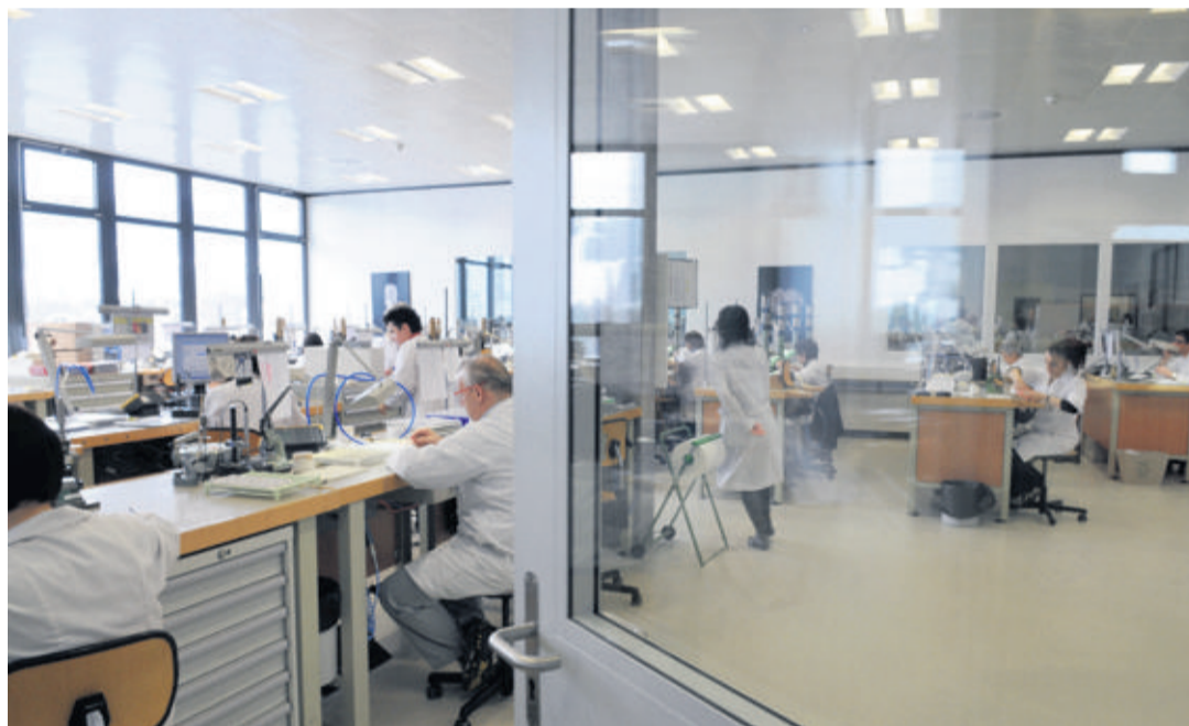
Les entreprises horlogères combières, comme Jaeger-LeCoultre, ont oublié la crise de 2008 et engagé du personnel. MICHEL DUPERRÉ

La crise économique semble bel et bien derrière. «C'est vrai, nous sommes aujourd'hui en pleine reprise», confirme Audrey Barlet, responsable du recrutement chez Audemars Piguet. Et s'ils ont pour cadre l'univers horloger, les postes à repousser ne concernent pas que la partie «manufacture» des entreprises, mais touchent égale-